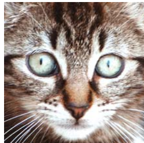
et plusieurs semaines plus tard, après traitement